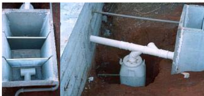
Figura 03 – Dispositivo retentor de particulados e de descarte

O objetivo destes dispositivos é de melhorar a qualidade da água a ser reservada, removendo material particulado de maior dimensão assim como descartar os primeiros litros de água precipitada (figura 03).