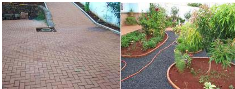
Figura 09 – Piso intertravado e área verde

Nas áreas externas, a pavimentação foi executada com blocos de concreto intertravados (figura 09), que permitem parcial infiltração da água no solo. As áreas verdes (jardins) também contribuem para a retenção da água escoada, empregando-se microbacias (depressões) para o plantio de arbustos e árvores. O jardim proporciona adicionalmente a evapotranspiração.