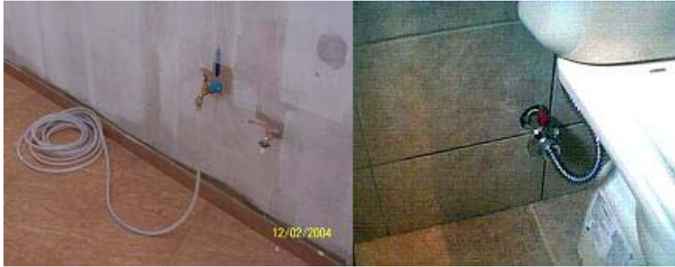
Figura 05 – Ponto de consumo de água pluvial na área externa e de alimentação do vaso sanitário

Como medida de redução da demanda de água pluvial, foi utilizado vaso descarga de vazão reduzida (VDR) de 6,8 litros, com acionamento do tipo “dual-flush”, que permite o usuário a escolha de meia ou descarga inteira (figura 06).