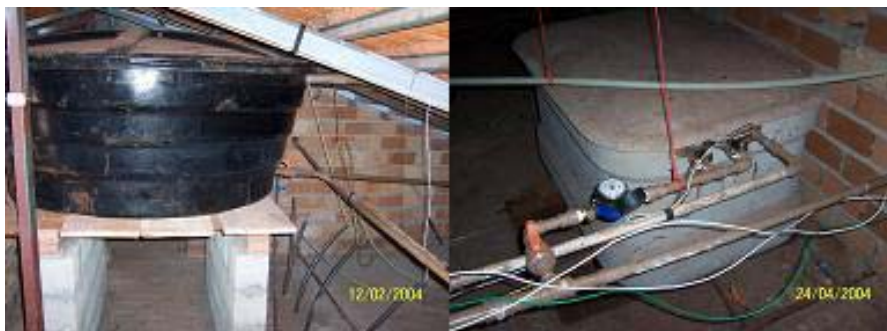
Figura 04 – Reservatório principal e secundário de distribuição de água

Os reservatórios superiores, com capacidade de 1,25 m 3 (figura 04), têm a função de armazenar a água que será distribuída através de um sistema predial específico de água fria (concomitantemente ao de água potável), constituindo-se num sistema dual de distribuição (figura 05). O reservatório menor abastece exclusivamente os vasos sanitários.