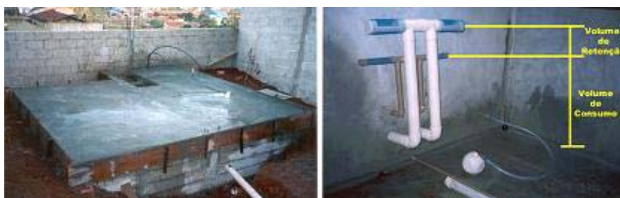
Figura 07 – Cisterna de acumulação e vista interior

Neste reservatório é acumulada a água pluvial, constituindo-se na reserva de água para uso futuro assim como cumprindo o papel de retenção provisória da água excedente de consumo, retardando sua descarga no macro sistema de drenagem urbana (figura 07). Possui 14,70 m 3 de capacidade de reserva.