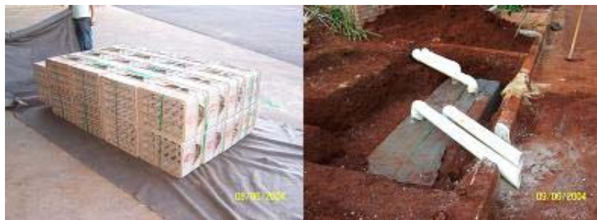
Figura 08 – Reservatório permeável para detenção de água pluvial executado com material reciclável

Nas áreas externas, a pavimentação foi executada com blocos de concreto intertravados (figura 09), que permitem parcial infiltração da água no solo. As áreas verdes (jardins) também contribuem para a retenção da água escoada, empregando-se microbacias (depressões) para o plantio de arbustos e árvores. O jardim proporciona adicionalmente a evapotranspiração.