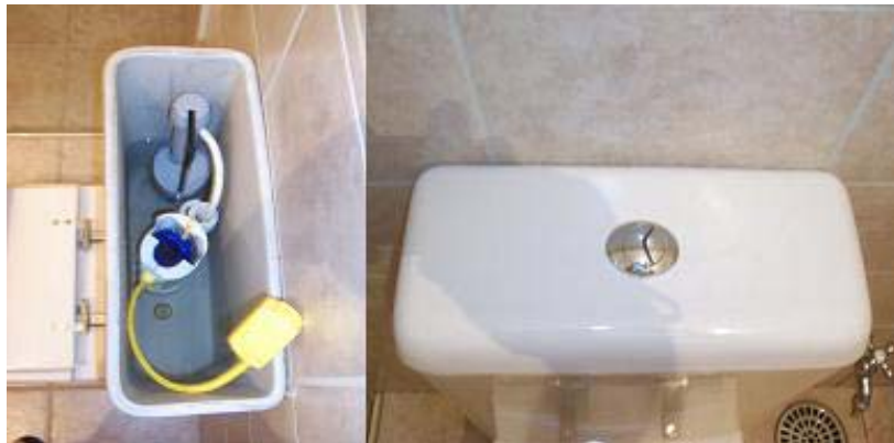
Figura 06 – Vaso sanitário tipo VDR e acionamento tipo “dual-flush”

Como medida de redução da demanda de água pluvial, foi utilizado vaso descarga de vazão reduzida (VDR) de 6,8 litros, com acionamento do tipo “dual-flush”, que permite o usuário a escolha de meia ou descarga inteira (figura 06).